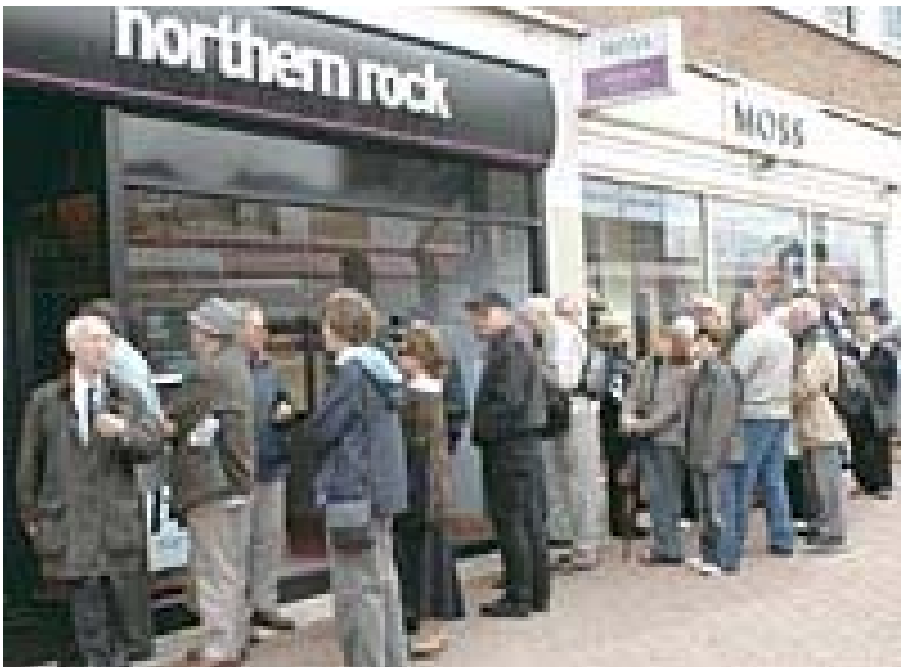
Ουρές έξω από την Northern Rock για να πάρουν τα λεφτά τους. Το συνολικό ποσό των αναλήψεων έφτασε τα 3 δισεκατομμύρια ευρώ

είχαν πάθει όλες οι τράπεζες. Έτσι σταμάτησαν να δανείζουν η μία στην άλλη.