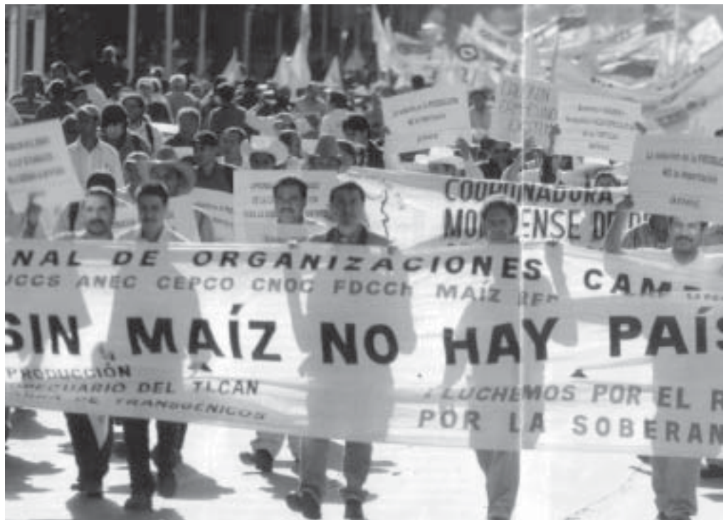
Διαδηλώσεις και συγκρούσεις στην πόλη του Μεξικού τον Φλεβάρη, ανάμεσα σε χιλιάδες διαδηλωτές και την αστυνομία, με αφορμή την αύξηση κατά 60% στην τιμή των τορτίγιας, βασικό είδος διατροφής από καλαμπόκι για τους Μεξικανούς