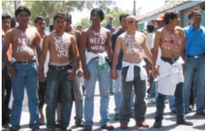
Από εκδήλωση – πορεία που κάλεσε η ΚΙΣΑ σε αλληλεγγύη με τους εξεγερμένους μετανάστες έξω από τις φυλακές τον Μάη του 2006

Είναι τροπή μετά από όλα αυτά να βγαίνει η κυβέρνηση και να δηλώνει ότι δεν διαπραγματεύεται κάτω από «απειλές και εκβιασμούς», και να τους κόβει το νερό και την τροφή. Ποια απειλή αποτελούν οι 6 (ο ένας κατάρρευσε ήδη και οι υπόλοιποι έμειναν για 65 ώρες