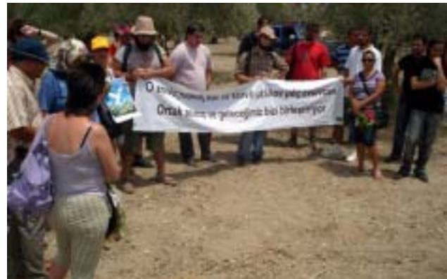
Φωτό πάνω: ηουλούδια από ε/κ και τ/κ στον ομαδικό τάφο στο Παρισινού.

Φωτό κάτω: οι τ/κ σύντροφοι μας μετέφεραν και τα δικά μας ηουλούδια στον ομαδικό τάφο στο Παλαιόκυθρο μετά την άρνηση των τουρκοκυπριακών αρχών να μας επιτρέψουν να πάμε εκεί μαζί. Είναι καιρός πια να ξεκινήσουμε εκστρατεία για τη δημιουργία ενός κοινού μνημείου για τα άθωα θύματα των πολέμων στη Κύπρο, όπου να πηγάινουμε μαζί να τα τιμούμε κάθε χρόνο.