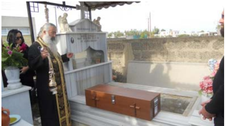
Ο Κυριάκος και η Μαρία θα βρεθούν ξανά μαζί

σημασίας κρατούνται μυστικές από τα παιδιά μας στο σχολείο, τι μαθαίνουν αν δεν τα μαθαίνουν αυτά; Και μπορούμε να το ονομάσουμε «εκμάθηση»;